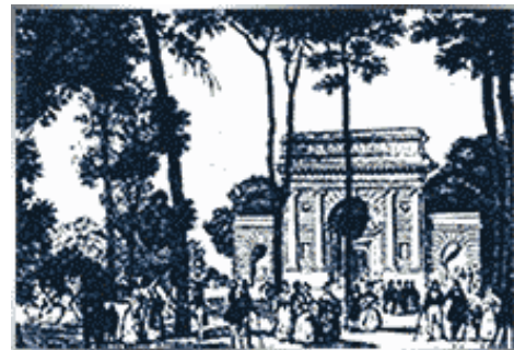
Università degli Adulti